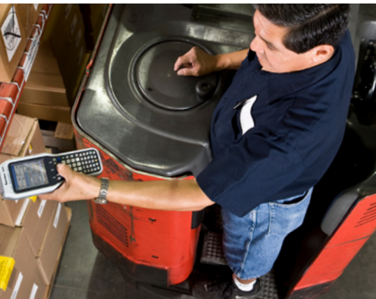
Movilizer hat AstraZeneca mit einem einfachen und robusten Arbeitsinterface für einfaches Scannen ausgestattet.